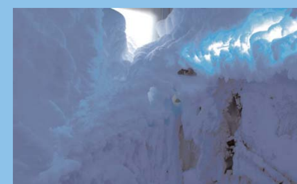
Nella grotta innevata, per un piacevole brivido blu!